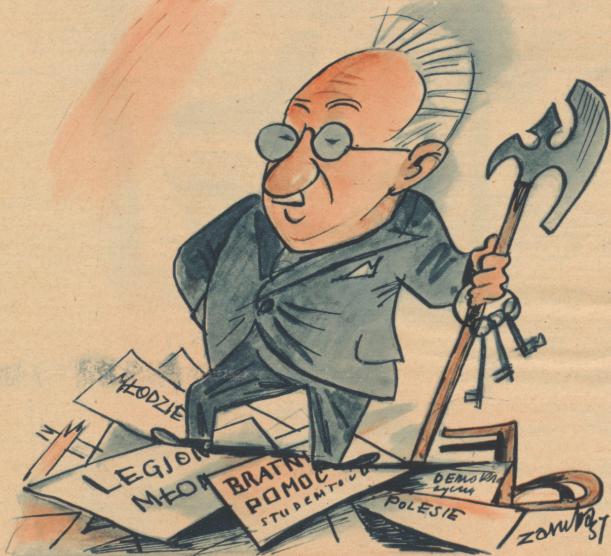
Min. prof. Świętosławski jako pogromca rozpolitykowanej młodzieży.