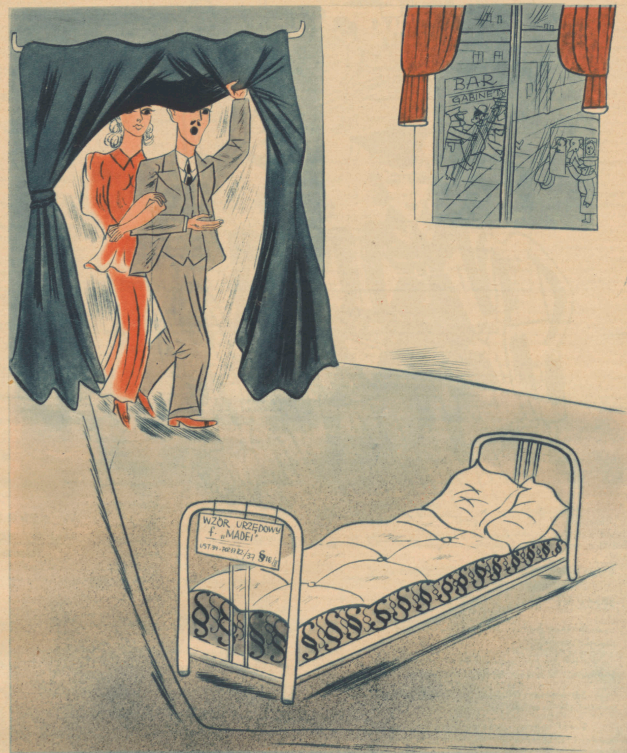
Oto praktyczny wzór umeblowania sypialni małżeńskiej.