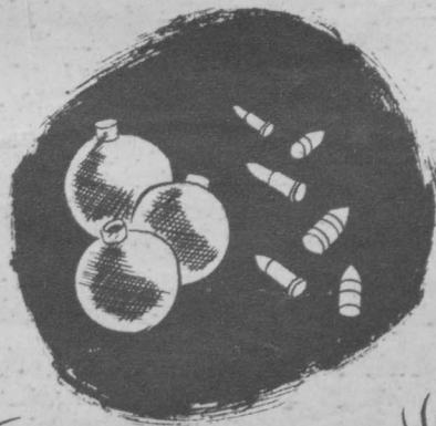
„Pomarańcze i daktyle“.