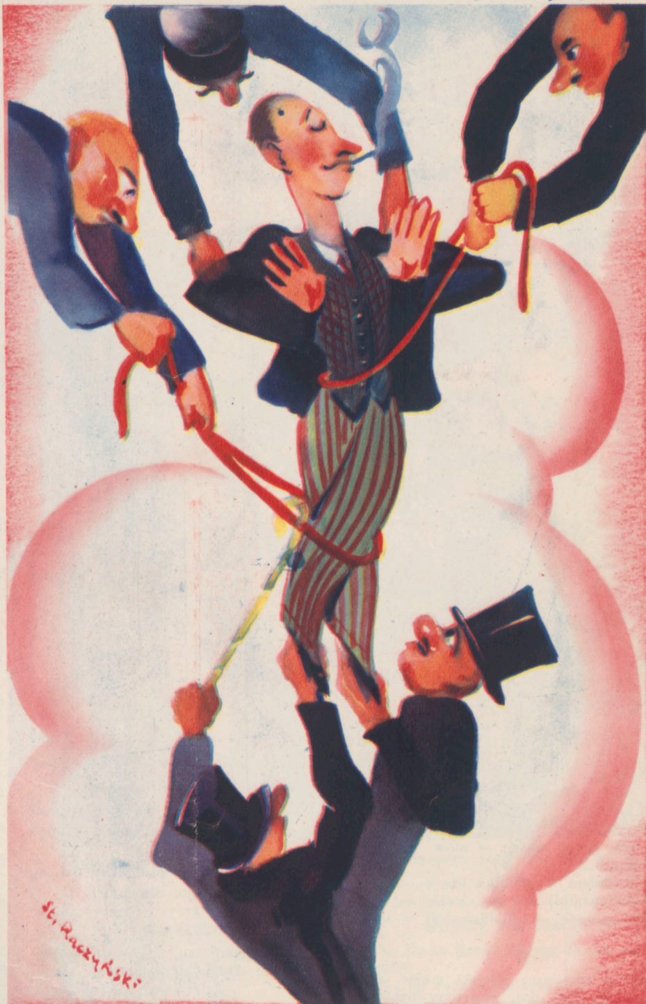
Protégowany, który dziwnie „idzie w górę“...