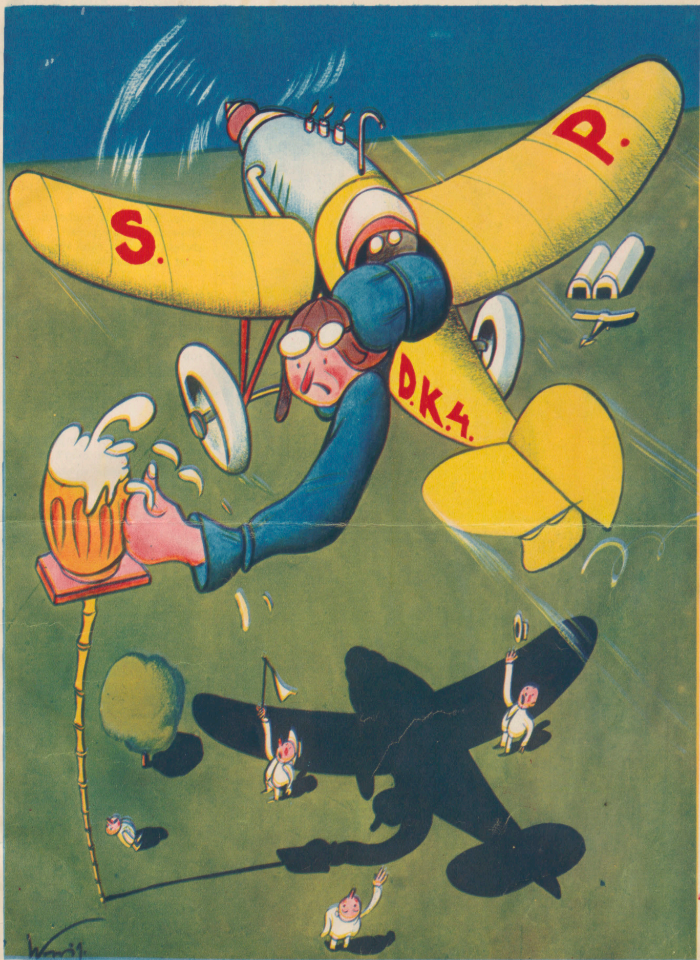
Pięć karnych kropli piany straciłem —